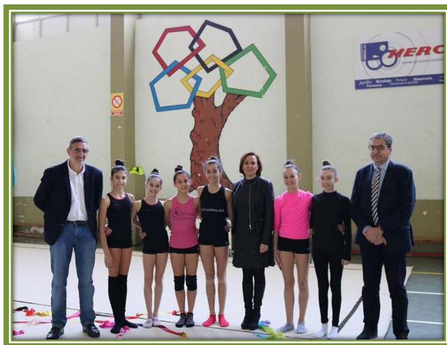
EM El Olivar. Presentación del Programa. Deportistas de Gimnasia Rítmica