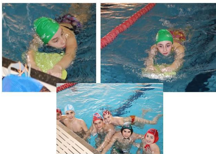
St. Casablanca. Presentación del programa. Deportistas de natación y waterpolo.

Plazo para la presentación de solicitudes en la Dirección General de Deporte: desde la publicación en Boletín Oficial de Aragón de la Orden por la que se regula la implantación del programa Aulas de Tecnificación Deportiva para la compatibilización de estudios y entrenamientos de deportistas aragoneses en edad escolar y se realiza su convocatoria para el curso 2017/18 , hasta el día 9 de junio.