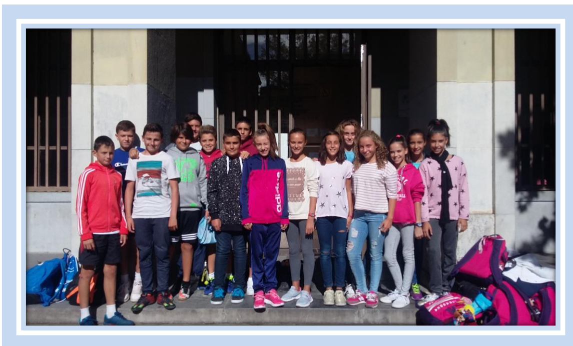
IES Goya de Zaragoza. Grupo de alumnos deportistas participantes en el programa Aulas de Tecnificación Deportiva Curso escolar 2016/17

Un total de 16 alumnos aragoneses han participado este curso en el primer programa piloto de tecnificación deportiva cualificada que el Gobierno de Aragón ha impulsado desde el Departamento de Educación, Cultura y Deporte y que forma parte del Plan de Tecnificación Deportiva de Aragón. Este programa se ha implantado con carácter experimental durante el curso escolar 2016/2017 en el Instituto de Educación Secundaria Goya de Zaragoza y en colaboración con las federaciones deportivas aragonesas de natación, tenis y gimnasia y los clubes deportivos Stadium Casablanca y EM El Olivar.