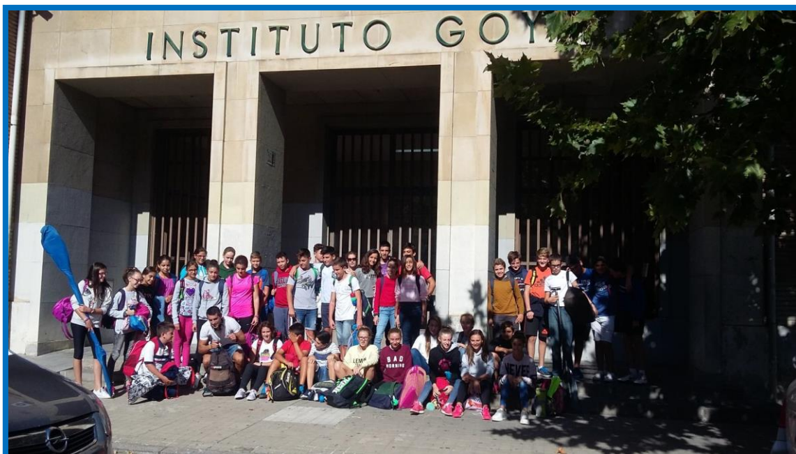
IES Goya de Zaragoza. Grupo de alumnos deportistas participantes en el programa Aulas de Tecnificación Deportiva Curso escolar 2017/18

El programa se desarrolla en colaboración con federaciones deportivas, clubes e instituciones comarcales y municipales, según su ámbito de aplicación.