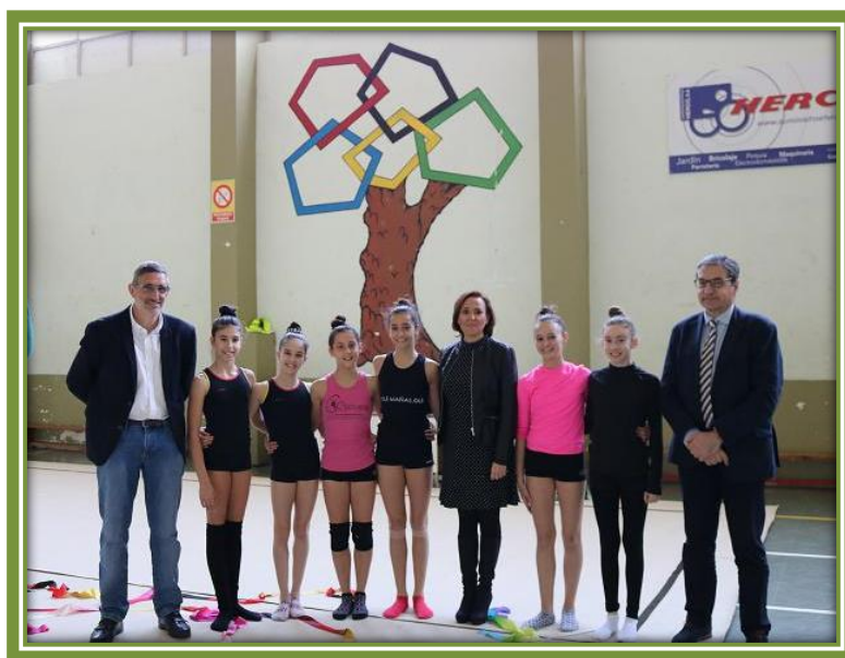
EM El Olivar. Presentación del Programa. Deportistas de Gimnasia Rítmica

4. Refuerzo de la tutorización de los alumnos deportistas, ampliando el número de periodos semanales lectivos de tutoría y la orientación de los mismos. El papel que ejerce el tutor en el desarrollo del proyecto es fundamental por ser el nexo de unión entre los profesores de las diferentes materias y ejercer como coordinador de todas las acciones formativas desarrolladas por los equipos docentes, directores técnicos federativos, técnicos deportivos y familias.